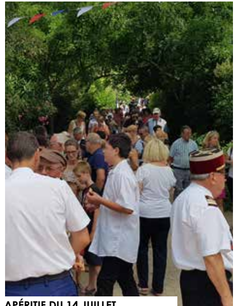
APÉRITIF DU 14 JUILLET