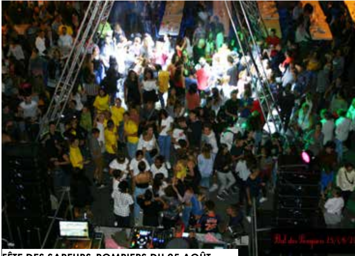
FÊTE DES SAPEURS-POMPIERS DU 25 AOÛT