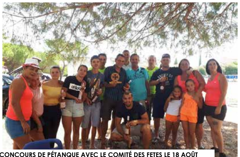
CONCOURS DE PÉTANQUE AVEC LE COMITÉ DES FÊTES LE 18 AOÛT