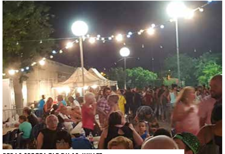
REPAS SPECTACLE DU 13 JUILLET