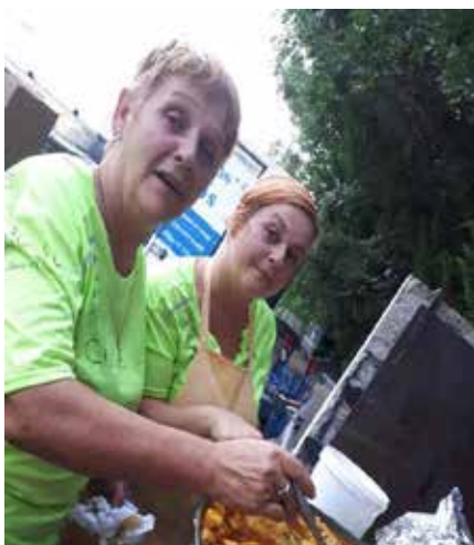
PAËLLA DU COMITÉ DES FÊTES DU 18 AOÛT