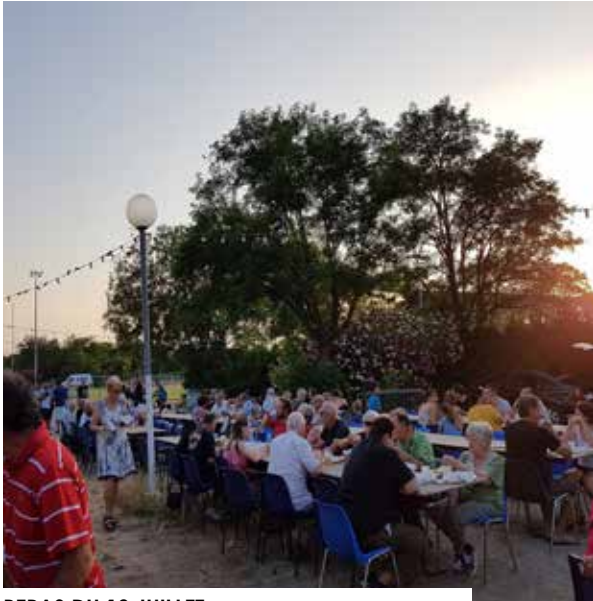
REPAS DU 13 JUILLET