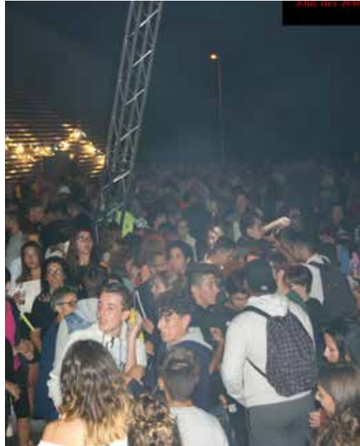
FÊTE DES SAPEURS-POMPIERS DU 25 AOÛT