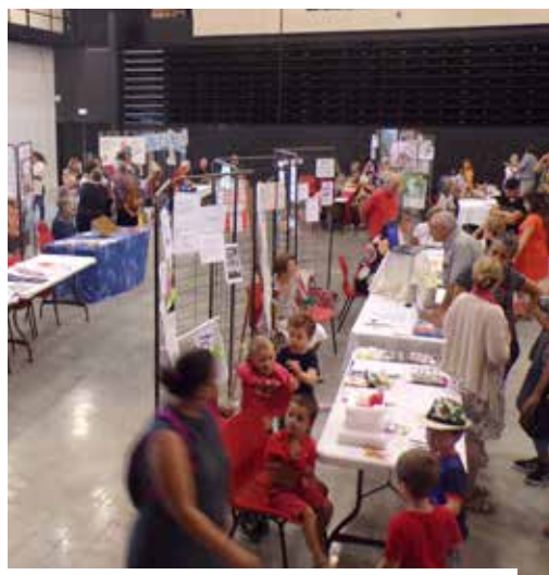
JOURNÉE DES ASSOCIATIONS