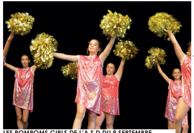
LES POMPOMS GIRLS DE L'A.S.D DU 8 SEPTEMBRE