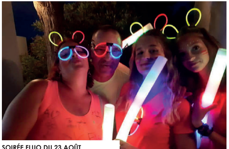
SOIRÉE FLUO DU 23 AOÛT