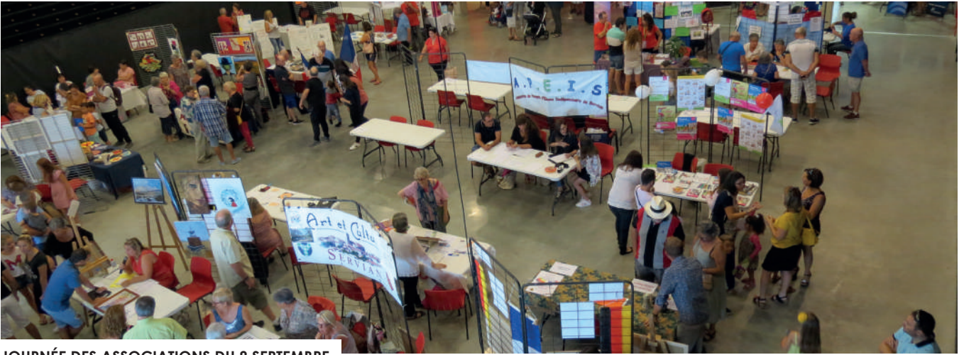
JOURNÉE DES ASSOCIATIONS DU 8 SEPTEMBRE