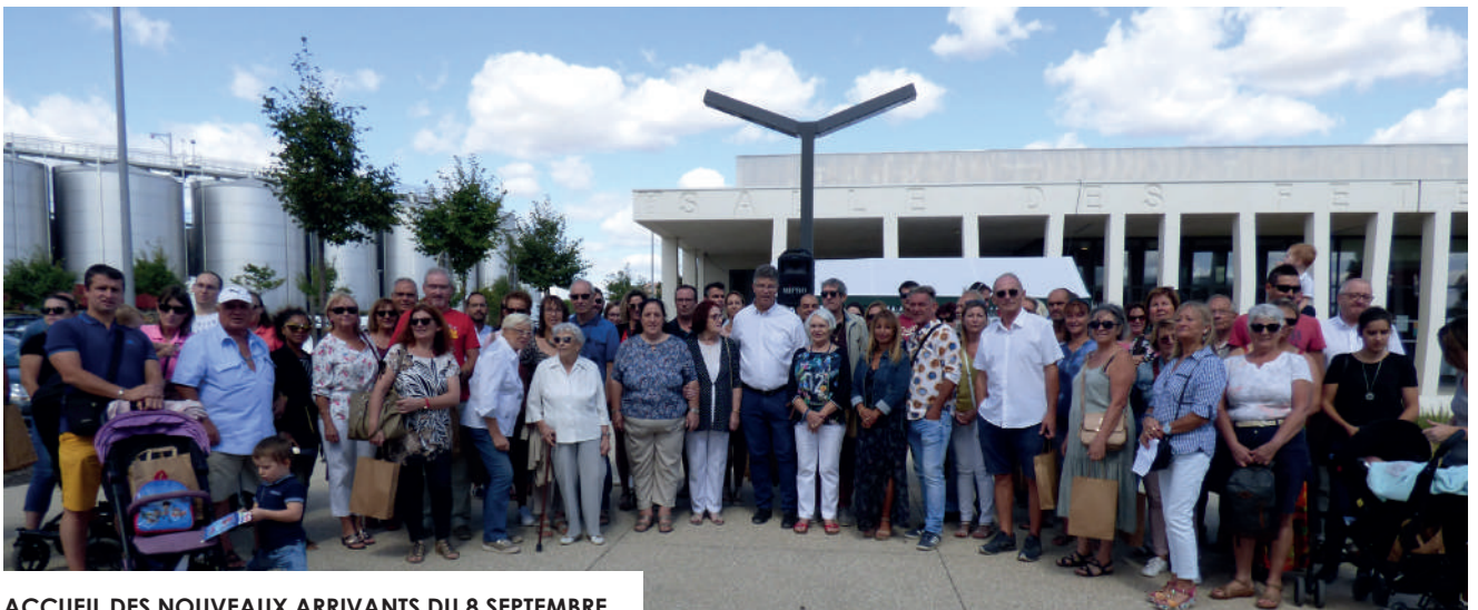
ACCUEIL DES NOUVEAUX ARRIVANTS DU 8 SEPTEMBRE