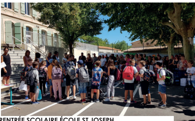
RENTÉE SCOLAIRE ÉCOLE ST JOSEPH