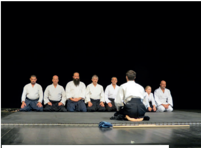
DÉMONSTRATION MINAMI AÏKIDO DU 8 SEPTEMBRE