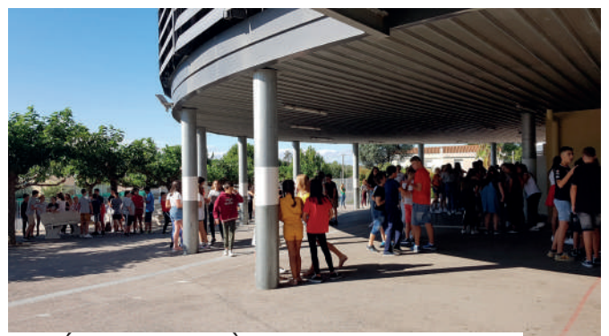
RENTÉE SCOLAIRE COLLÈGE ALFRED CROUZET