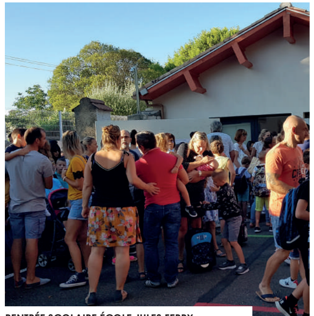
RENTÉE SCOLAIRE ÉCOLE JULES FERRY