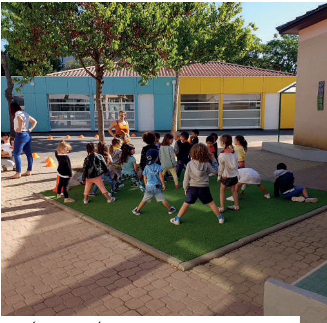
RENTÉE SCOLAIRE ÉCOLE JEAN-MOULIN